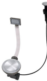
Desagüe automático Space Push - PP 8407 116