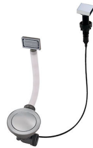
Desagüe automático Space - PA 8407 108