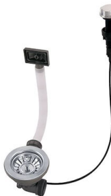
Desagüe automático 8407 100