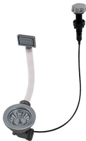
Desagüe automático Gun metal - PG 8407 110